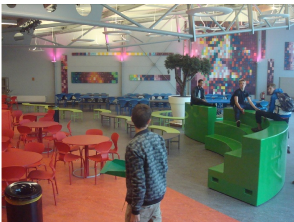
Sala adibita a manifestazioni scolastiche